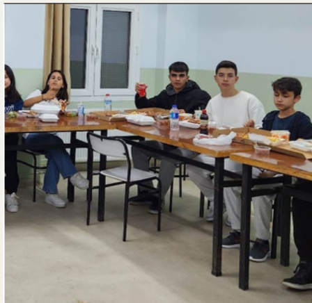
10/A ve Ebrar Hocamız