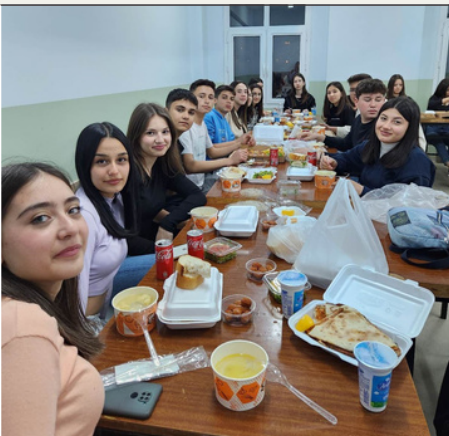
10/A ve Ebrar Hocamız